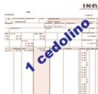
Cedolino Paga Dipendenti