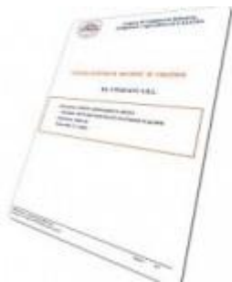
Visura Ordinaria Camera di Commercio

Il vantaggio che ottieni utilizzando il nostro Centro di Elaborazione dati , è avere un servizio di elaborazione paghe on line a tua disposizione risparmiando i costi di struttura. Non solo, oltre alle buste paga, se ti rivolgerai ad una delle nostre sedi territoriali, potrai essere assistito tutti gli altri adempimenti caratterizzanti il rapporto di lavoro subordinato, il lavoro domestico (COLF) , il rapporto contributivo di artigiani e commercianti, le comunicazioni telematiche al centro impiego per instaurare o cessare un rapporto di lavoro, variarne l'orario di lavoro o comunicarne la trasformazione a tempo indeterminato, conteggi di lavoro e molto altro.. di seguito alcuni dei Servizi offerti