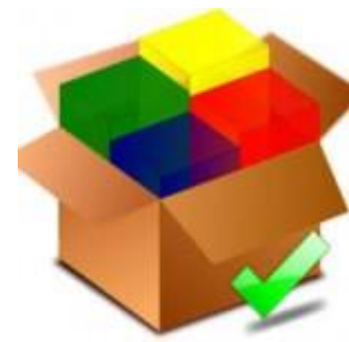
Start up dipendenti